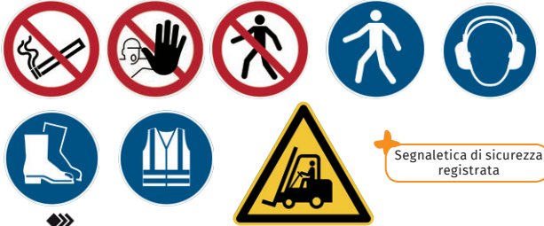
Segnaletica di sicurezza registrata